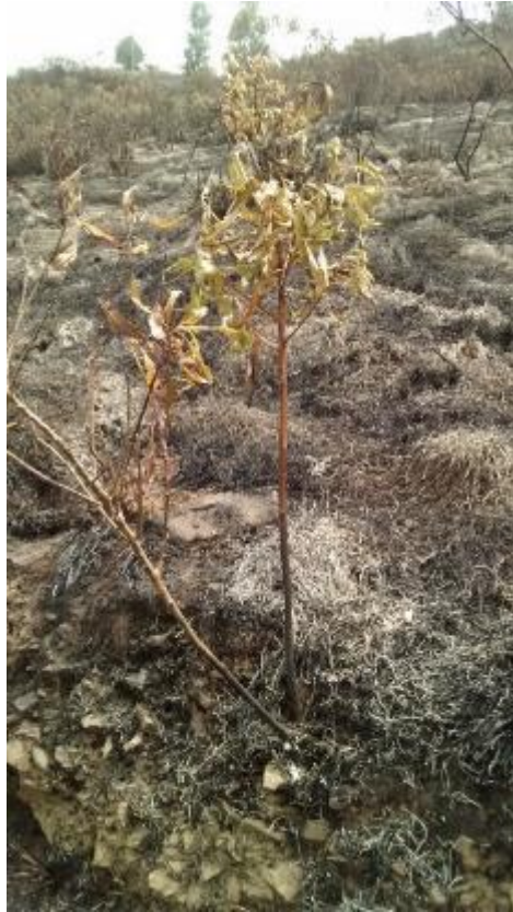
FOTO 12. Hayuelo ( Dodonaea viscosa ) afectado por el incendio forestal

Un factor que facilitó la propagación del fuego fue la cobertura de Helecho Marranero, el cual genera una biomasa seca, que sirvió como combustible para la expansión del incendio (Ver FOTO 13).