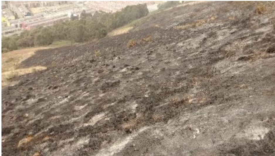
FOTO 6. Afectación sobre el suelo en Pajonales del enclave subxerofítico.