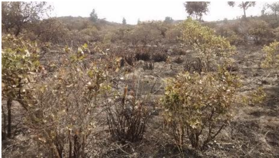
FOTO 3. Sector occidental del incendio donde se observa que la cobertura afectada en este sector corresponde a matorrales del enclave subxerofítico.

A continuación se presentan unas fotografías que describen lo visto en la visita de campo hacia el SECTOR OCCIDENTAL del Cerro Guacamayas: