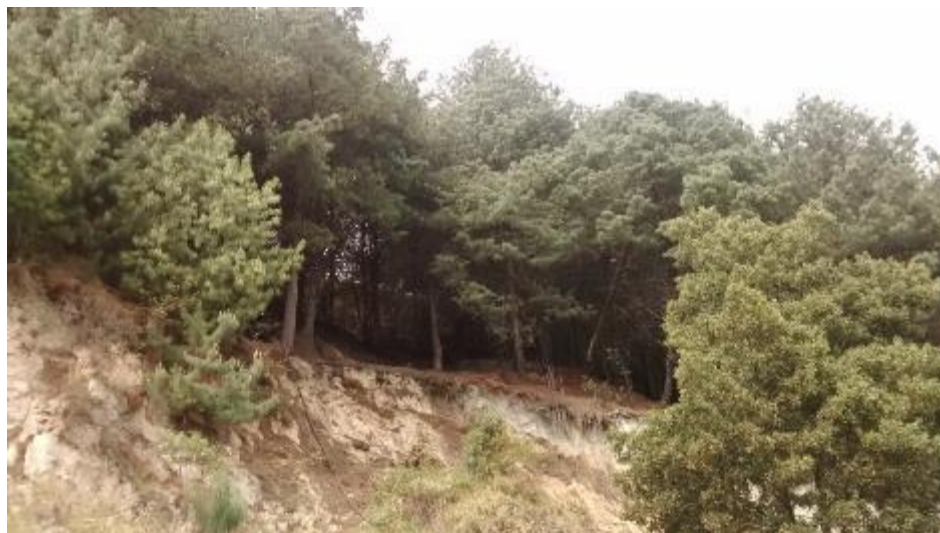
FOTO 1. Sector oriental del incendio donde se observa que la cobertura afectada corresponde a plantación de Pino Pátula ( Pinus patula )

A continuación se presentan unas fotografías que describen lo visto en la visita de campo hacia el SECTOR ORIENTAL del Cerro Guacamayas: