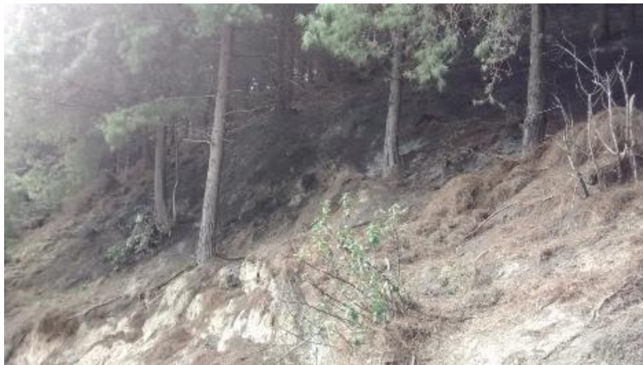
FOTO 7. Plantaciones de Pinus patula afectadas por el incendio

En el sector oriental la vegetación afectada fue Pinus patula (Ver Foto 7).