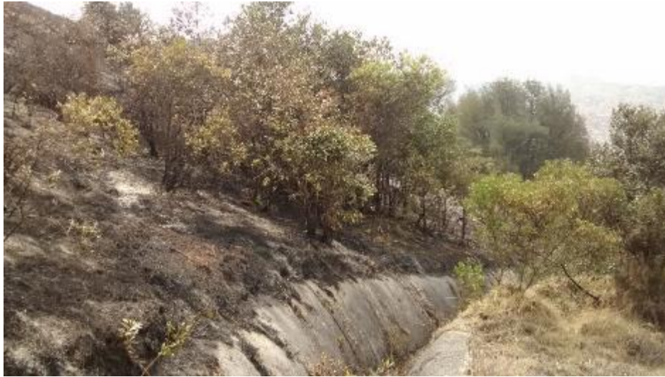
FOTO 4. Canal que actuó como barrera cortafuego para que le fuego no avanzara.