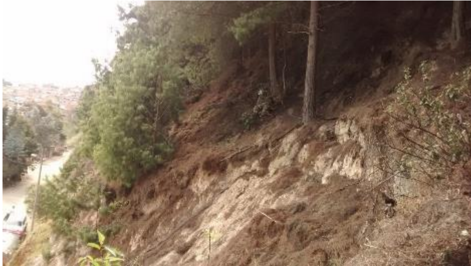
FOTO 2. El incendio se propagó por el colchón de acícula en un terreno con pendientes que oscilan entre 40 y 50°

A continuación se presentan unas fotografías que describen lo visto en la visita de campo hacia el SECTOR OCCIDENTAL del Cerro Guacamayas: