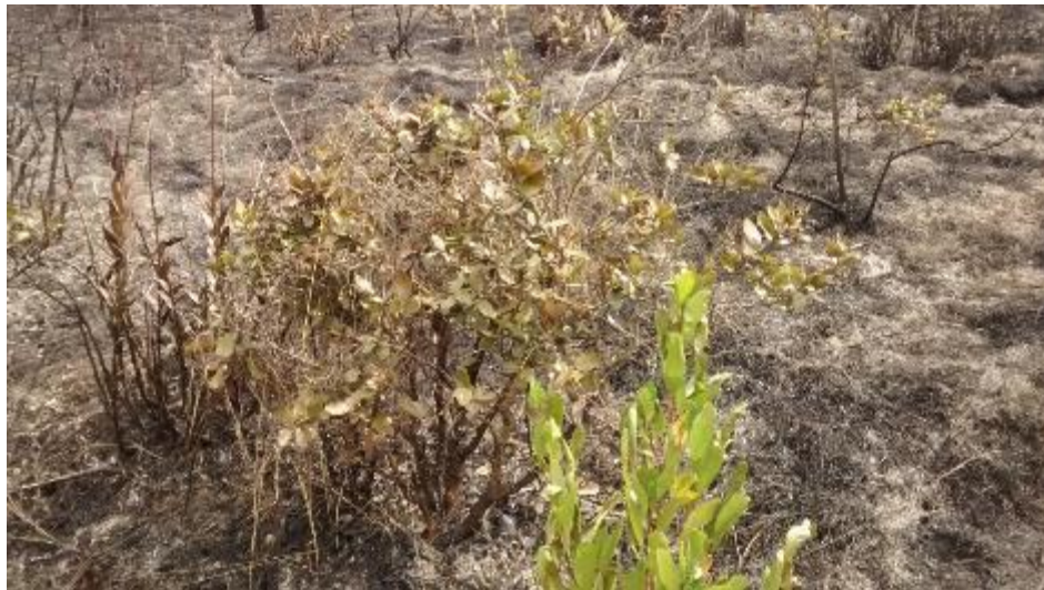
FOTO 9. Corono ( Xylosma especuliferum ) afectado por el incendio forestal