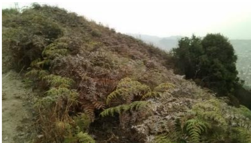
FOTO 13. Helechales que facilitan la propagación del fuego

Un factor que facilitó la propagación del fuego fue la cobertura de Helecho Marranero, el cual genera una biomasa seca, que sirvió como combustible para la expansión del incendio (Ver FOTO 13).