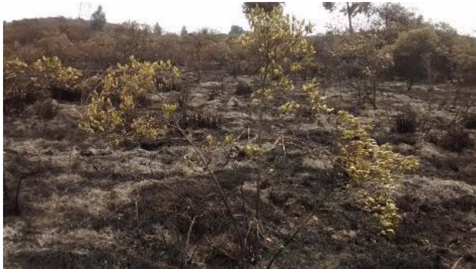
FOTO 11. Ciro ( Baccharis multiflora ) afectado por el incendio forestal

A continuación se listan las especies nativas vegetales afectadas, de acuerdo a la inspección ocular.