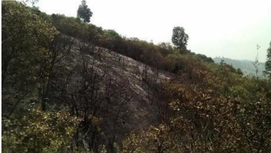
FOTO 8. Matorral de enclave subxerofítico afectado por el incendio

A continuación se listan las especies nativas vegetales afectadas, de acuerdo a la inspección ocular.