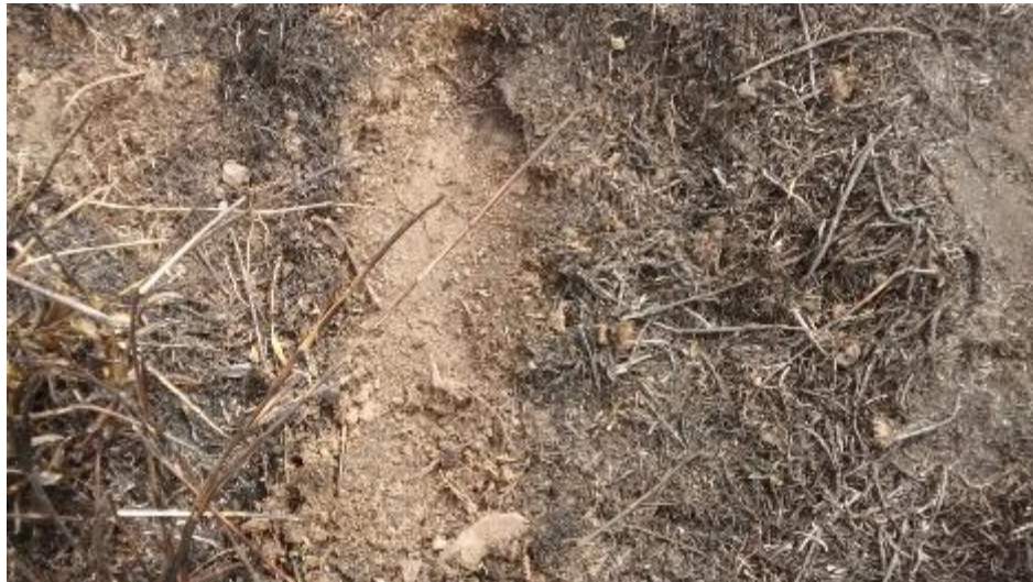
FOTO 5. Afectación sobre el suelo en Plantaciones de Pino

Durante el recorrido se evidenció que el incendio sobre el suelo fue superficial, afectando el colchón de acícula hacia el costado oriental y, pajonales y pastos hacia el costado occidental. Al profundizar en el horizonte del suelo, se observan raíces vivas, así como color y textura normal del mismo, tal y como se evidencia en la FOTO 5 y la FOTO 6.