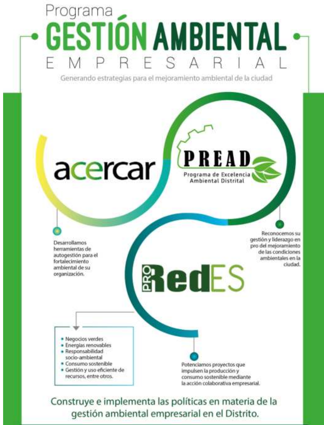
Figura 1. Esquema del Programa de Gestión Ambiental Empresarial