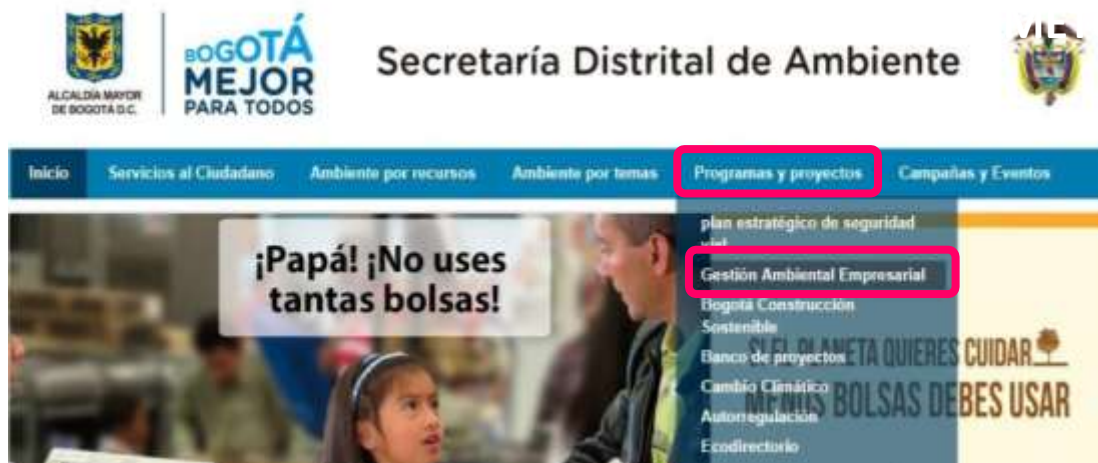
Figura 2. Ingreso a la página web del PREAD a través del portal de la Secretaría Distrital de Ambiente http://www.ambientebogota.gov.co/web/sda

1.7.1. Toda la información reglamentaria sobre el PREAD la encuentra en la Resolución 00011 de 2019, en donde se presentan los lineamientos de operación, beneficios del programa, obligaciones y causales de exclusión. Igualmente, toda la información referente a la convocatoria la encontrará en la página Web de la Secretaría Distrital de Ambiente, tal como se presenta en las Figuras 2 y 3.