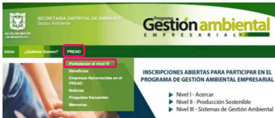
Figura 3. Ingreso a la página del PREAD desde la plataforma del Programa de Gestión Ambiental Empresarial http://www.ambientebogota.gov.co/es/web/gae/inicio