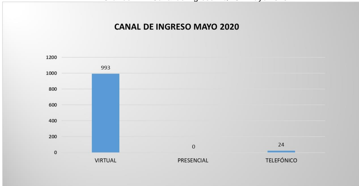
Gráfico N° 1 Canal de ingreso PQRSF mayo 2020