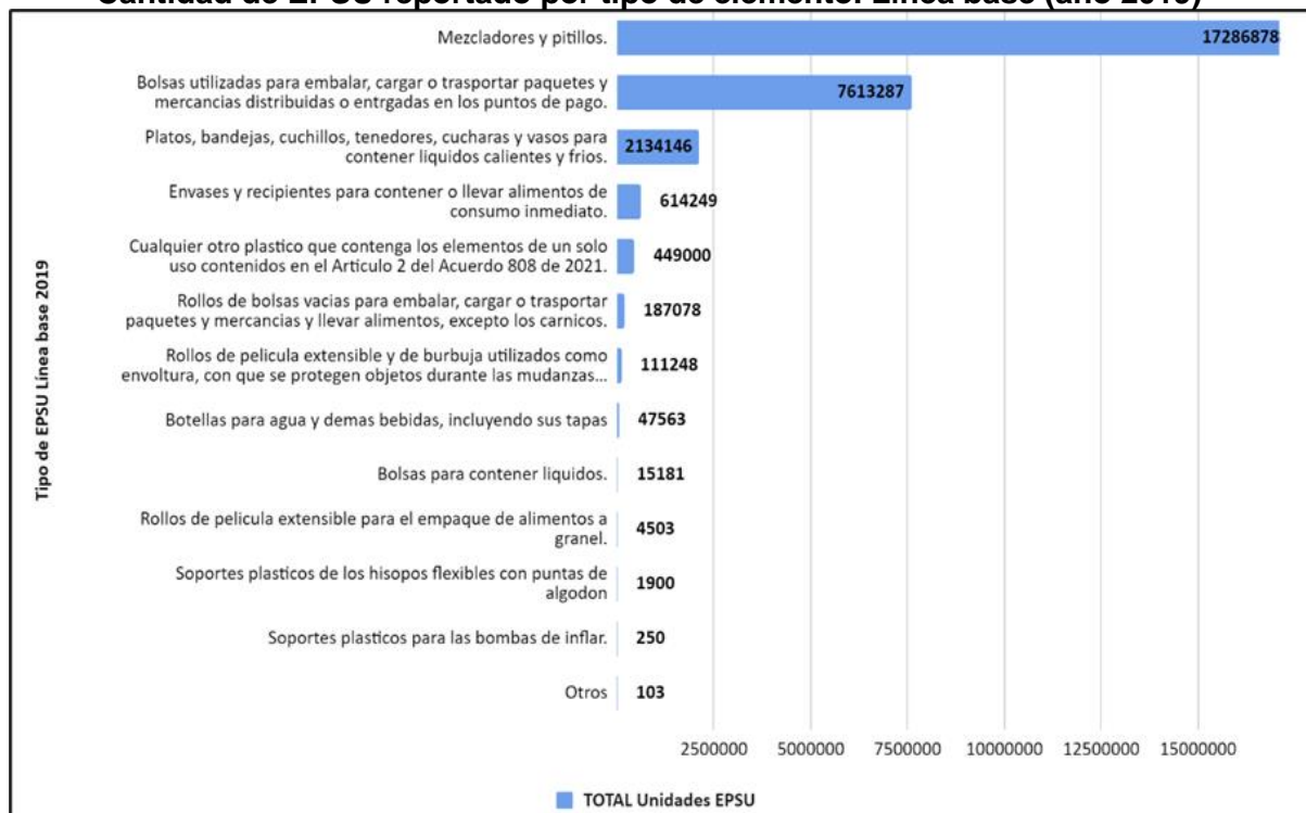
Cantidad de EPSU reportado por tipo de elemento. Línea base (año 2019)