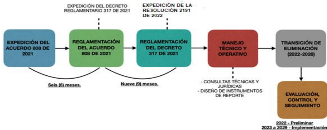
Figura 1. Plan general de implementación Acuerdo 808 de 2021.

Para la implementación del Acuerdo 808 de 2021, esta autoridad ambiental trazó un plan con las siguientes etapas, de las cuales se desagregan las acciones indicadas en el presente informe: