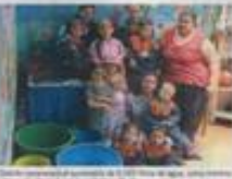
El Acueducto Distrital garantiza que el consumo mínimo vital de agua potable en Bogotá y sus zonas urbanas es de 6.000 litros por persona y mes. Este consumo mínimo vital no será cobrado a las familias de estrato 1.