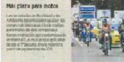
Más plaza para motos. Las motos de dos tiempos de una cilindrada que no superen los 125 cc. se aplicará a partir del 1 de noviembre.

BOGOTÁ. Las secretarías de Ambiente y de Armamento aplicarán por dos meses más la imposición de sanciones económicas para los vehículos de motor de dos tiempos que tienen restricción por la contaminación que generan al medio ambiente.