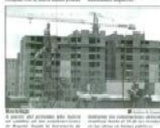
Muchacho. El alcalde mayor ordenó a través de la resolución 2397 de 2011 que a partir del próximo año se obligará a la reutilización de entre el 10 y 5 por ciento de dichos residuos.

A partir del próximo año los constructores que edifiquen obras en Bogotá deberán reutilizar por lo menos el 10 por ciento de los residuos de las obras. El alcalde mayor ordenó a través de la resolución 2397 de 2011 que a partir del próximo año se obligará a la reutilización de entre el 10 y 5 por ciento de dichos residuos.