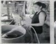
Con el plan de agua, la población más vulnerable de la ciudad será beneficiada.

El Plan Decenal del Agua fue presentado oficialmente por la Administración Distrital que persigue como objetivo las políticas de agua y la garantía de acceso a los servicios de agua potable para todos los bogotanos.