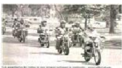
La prohibición de las motos de dos tiempos de una cilindrada que no superen los 125 cc. se aplicará a partir del 1 de noviembre.

Las motos de dos tiempos de una cilindrada que no superen los 125 cc. que se venden en Bogotá, serán prohibidas a partir del 1 de noviembre. A partir de entonces se empezará a aplicar. La prohibición de las motos de dos tiempos de una cilindrada que no superen los 125 cc. se aplicará a partir del 1 de noviembre. A partir de entonces se empezará a aplicar.